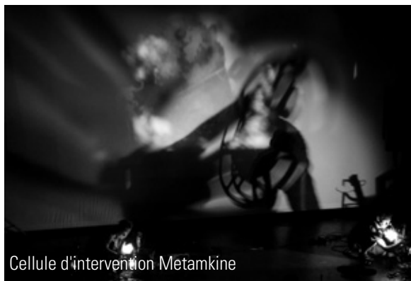
Cellule d'intervention Metamkine

CHRISTOPHE AUGER & XAVIER QUÉREL / films et projecteurs 16mm JÉRÔME NOETINGER / dispositif électroacoustique.